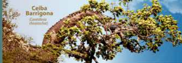
Ceiba Barrigona (Ceiba trichocarpa)

Administración de la Biodiversidad y sus servicios ecosistémicos.