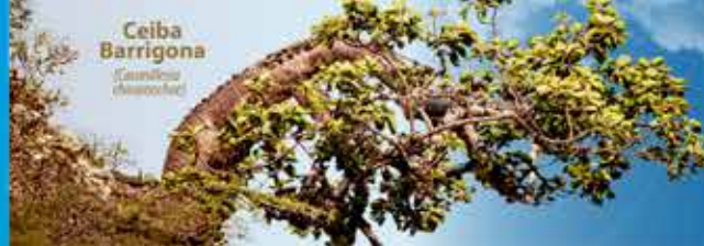
Ceiba Barrigona (Cecropia peltata)

Gestión Integral y Sostenible del Recurso Hídrico.