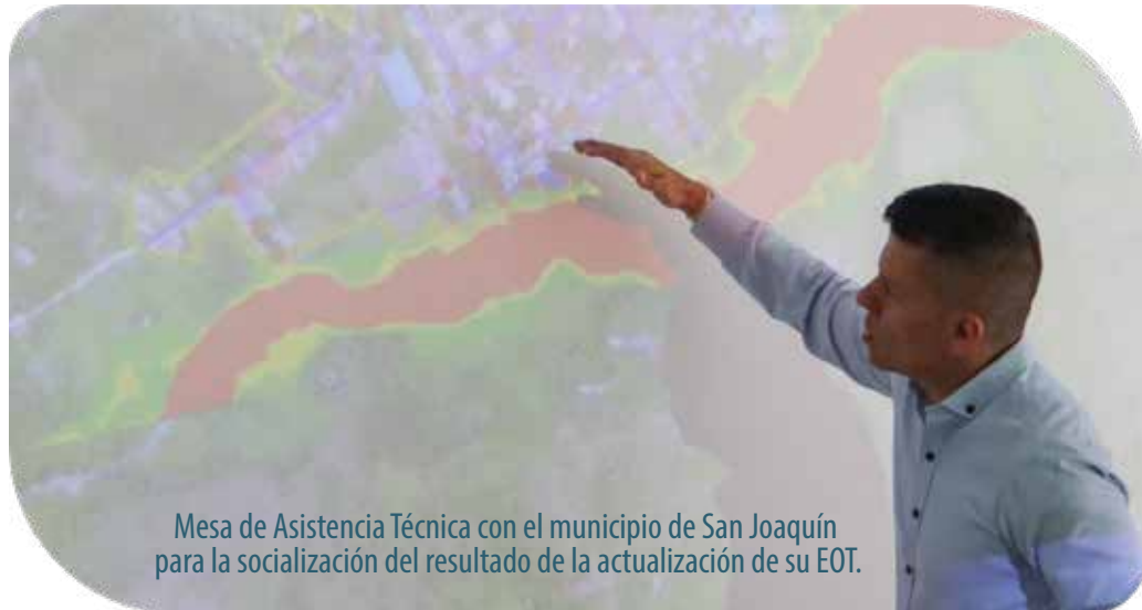
Mesa de Asistencia Técnica con el municipio de San Joaquín para la socialización del resultado de la actualización de su EOT.