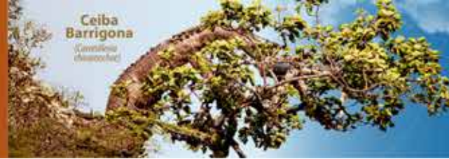
Ceiba Barrigona (Ceiba pentagonata)