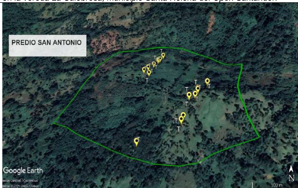
Imagen No. 2 Tocones evidenciados en campo, en el predio San Antonio, ubicado en la vereda La Culebrosa, municipio Santa Helena del Opón Santander.