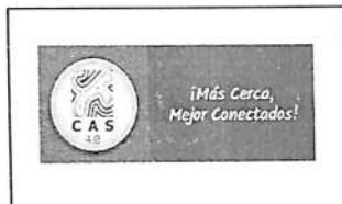
TABLA DE RETENCIÓN DOCUMENTAL