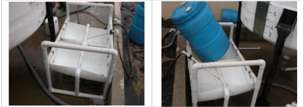
Fotografía 2-1 Dispositivo para lavado de envases de agroquímico